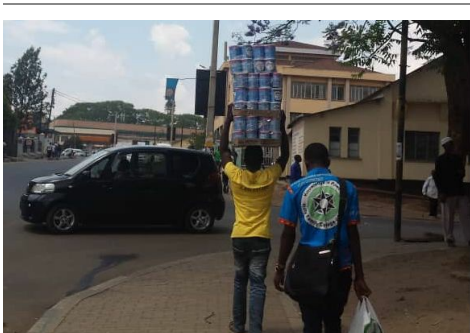
Zo kan het ook: Vervoeren van de likunipala

In september 2018 zijn twee studenten in de gelukkige positie gekomen om naar twee goede middelbare scholen te gaan. Stichting Lamp betaald het schoolgeld, uniform en schoenen. Deze middelen komen uit het Nguludi gebied. Één van de meiden heeft een gehoorbeperking en de lagere school binnen het dovenonderwijs gevolgd. Zij is een zeer goede student en daarom door de overheid geselecteerd tot een overheidsschool voor meisjes. De school, Stella Maris, wordt gerund door de overheid en zusters. Het andere meisje was helaas niet op deze school geselecteerd, waardoor WladiCare haar op een andere goede privé-school hebben geplaatst. Beide scholen zijn kostscholen, wat zeer gebruikelijk is in Malawi. De families hebben erg dankbaar dat hun dochters deze kans hebben gekregen. De toekomst van deze meiden ziet er een stuk positiever uit!